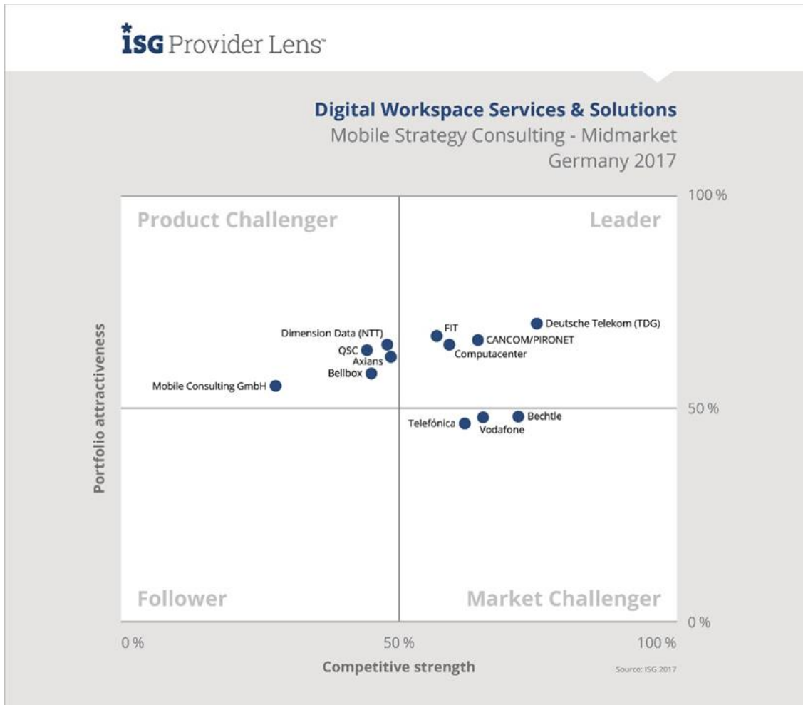
Quadrant für Mobile Strategy Consulting - Midmarket