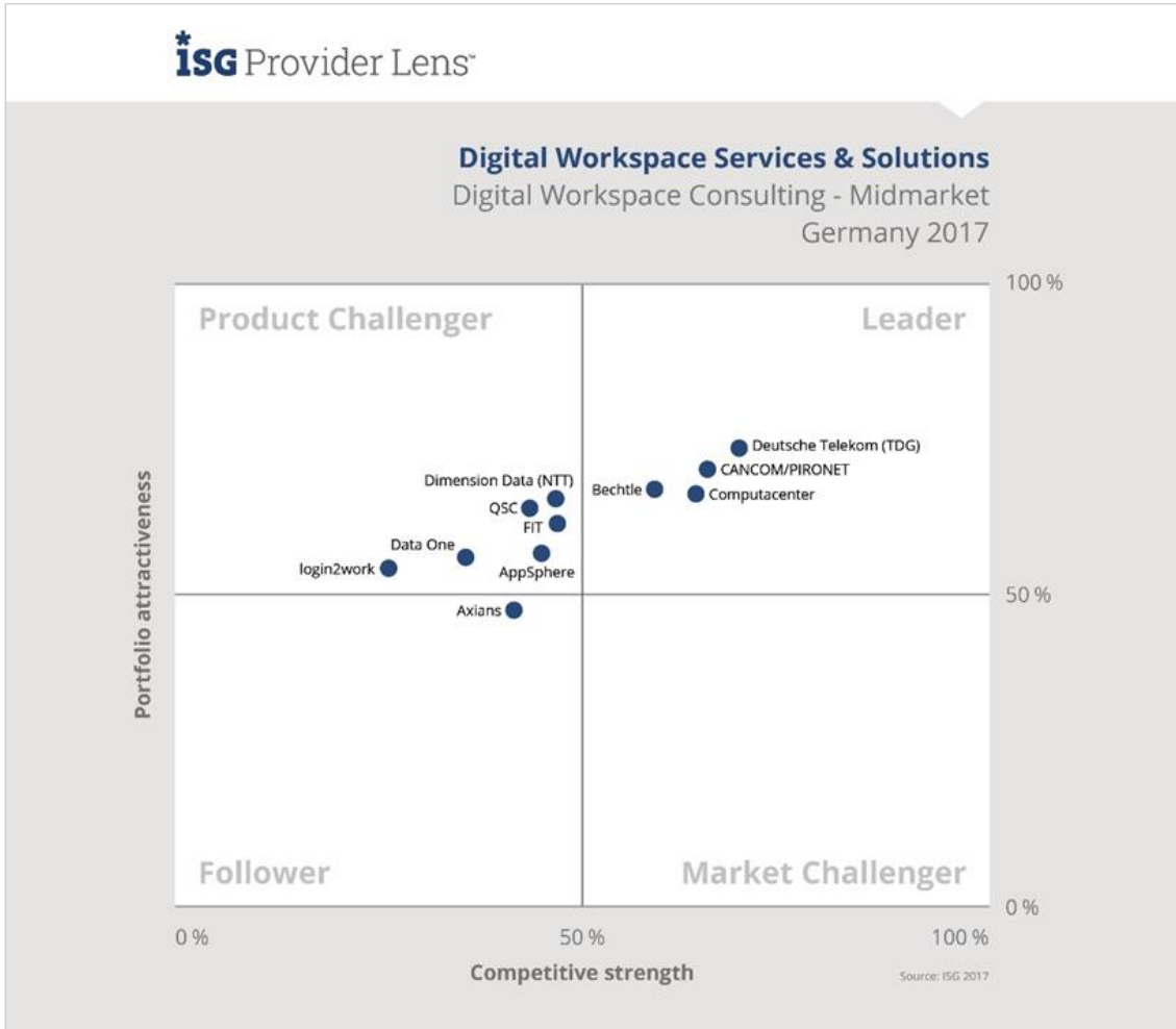
Quadrant für Digital Workspace Consulting - Midmarket