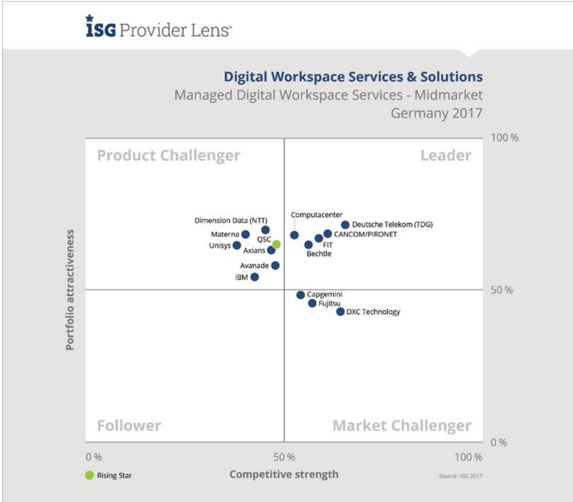
Quadrant für Managed Digital Workspace Services - Midmarket